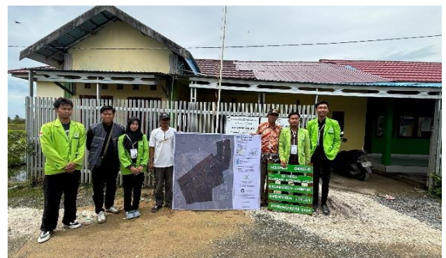
Gambar 4. Serah Terima Penanda Batas Desa

Setelah tahap pembuatan papan penanda selesai, tahap selanjutnya adalah pemasangan papan penanda di lokasi yang telah ditentukan pada tahap perencanaan. Sebelum dilakukannya pemasangan, terlebih dahulu dilakukan penyerahan papan penanda yang telah dibuat secara simbolik kepada pihak desa yang diwakili oleh aparat desa.