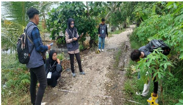
Gambar 2. Kegiatan Survei Lokasi oleh Mahasiswa dan Warga Desa

Pada tahapan survey ini, juga diskusi dilakukan secara terbuka sehingga keputusan yang diambil benar-benar merefleksikan kebutuhan nyata masyarakat. Antusiasme warga tampak jelas, tidak hanya sebagai penerima manfaat, tetapi juga sebagai mitra aktif dalam menentukan arah kegiatan. Survei ini kemudian menghasilkan kesepakatan tiga lokasi utama, yaitu gerbang masuk desa dari arah Jalan Raya Gambut, persimpangan menuju wilayah RT, dan area depan balai desa. Lokasi tersebut didokumentasikan menggunakan koordinat GPS dan foto lapangan, sebagaimana terlihat pada Gambar 2.