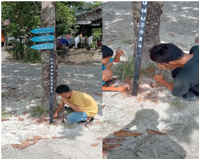
Gambar 5. Penggalian Lubang untuk Tiang Penyangga

Pemasangan papan penanda tidak dilakukan secara sembarangan, melainkan dengan memperhatikan prinsip-prinsip keterbacaan dan keamanan pengguna jalan. Kegiatan pemasangan papan penanda lainnya dapat dilihat pada Gambar 6.