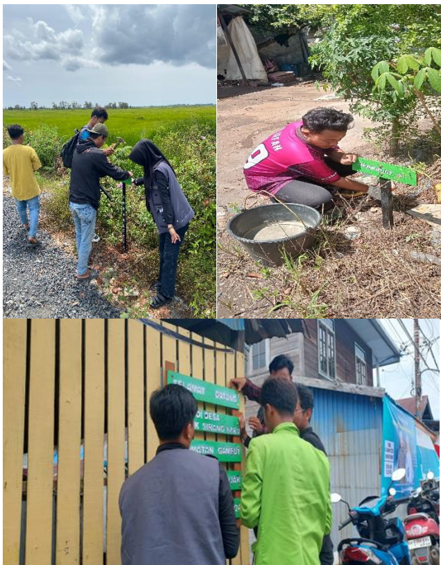
Gambar 6. Kegiatan Pemasangan Papan Penanda

Pemasangan papan penanda tidak dilakukan secara sembarangan, melainkan dengan memperhatikan prinsip-prinsip keterbacaan dan keamanan pengguna jalan. Kegiatan pemasangan papan penanda lainnya dapat dilihat pada Gambar 6.