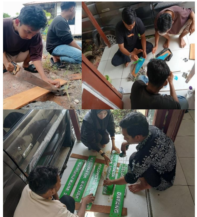
Gambar 3. Kegiatan Pembuatan Papan Penanda

mereka sebagai pengambil keputusan substansial. Aktivitas mahasiswa dan warga dalam pembuatan papan penanda ditunjukkan pada Gambar 3.