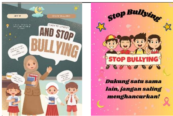
Gambar 7. Contoh Hasil Karya Poster Siswa

poster siswa yang ditampilkan pada akhir kegiatan dapat dilihat pada Gambar 7.