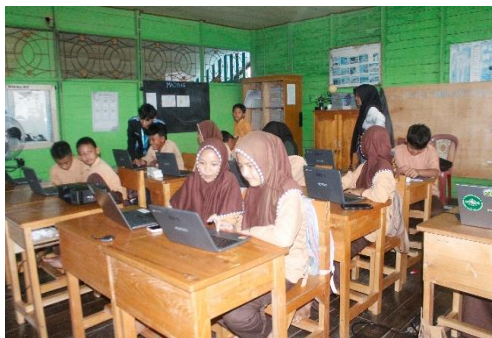
Gambar 4. Praktik Aplikasi Canva oleh Siswa

Pada sesi ini, siswa langsung diperkenalkan dengan berbagai fitur dasar yang terdapat dalam platform Canva. Setiap kali fasilitator menjelaskan satu fitur, seperti cara menuliskan teks, teknik memasukkan gambar, metode menambahkan elemen-elemen visual, dan cara mengganti warna, siswa langsung diberikan kesempatan untuk mencoba fitur tersebut secara langsung pada perangkat masing-masing. Aktivitas siswa mempraktikkan aplikasi Canva disajikan pada Gambar 4.