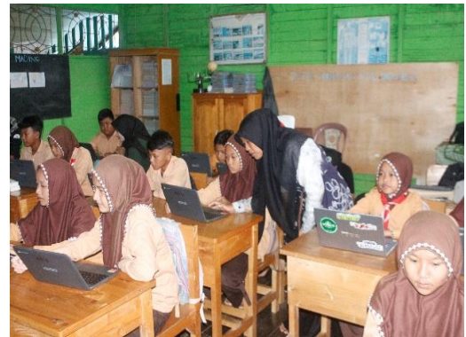
Gambar 5. Praktik Mandiri dan Pendampingan

diminta untuk membuat poster bertema anti-perundungan berdasarkan ide dan kreativitas mereka masing-masing. Dalam proses ini, siswa diberi kebebasan untuk memilih warna, gambar, maupun tata letak yang sesuai dengan pesan yang ingin mereka sampaikan. Fasilitator dan guru berperan aktif mendampingi siswa agar tetap fokus pada tema dan memastikan pesan moral tersampaikan dengan jelas. Kegiatan praktik mandiri dan pendampingan oleh mahasiswa KKN disajikan pada Gambar 5.