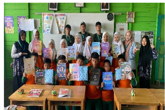
Gambar 6. Presentasi Poster Anti-Perundungan

Setelah menyelesaikan desain poster bertema anti-perundungan, setiap siswa diminta untuk menampilkan hasil karyanya di depan kelas dan menjelaskan pesan moral yang ingin disampaikan melalui desain tersebut. Fasilitator dan guru memberikan apresiasi serta umpan balik terhadap setiap karya, baik dari segi teknis desain maupun kedalaman pesan yang terkandung di dalamnya. Kegiatan presentasi poster anti-perundungan ditampilkan pada Gambar 6.