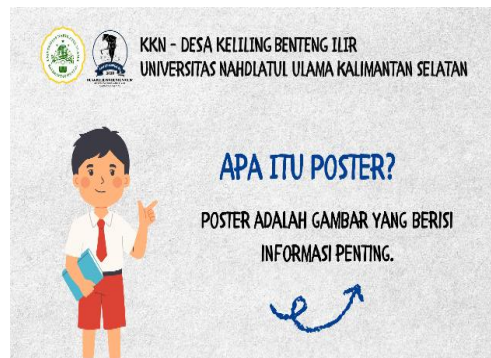
Gambar 2. Materi Pengenalan Poster

Selama kegiatan berlangsung, siswa terlihat antusias mengikuti penjelasan dan aktif menjawab pertanyaan yang diajukan. Kegiatan dan materi pengenalan desain poster edukatif dapat dilihat pada Gambar 2 dan Gambar 3.