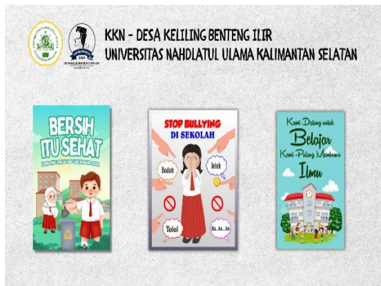
Gambar 3. Contoh Poster Edukasi