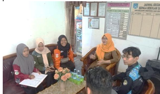
Gambar 1. Proses Koordinasi dan Perizinan

berjalan dengan baik. Proses ini mencakup koordinasi dengan kepala sekolah dan wali kelas VI terkait penjadwalan, pemilihan lokasi kegiatan, serta kebutuhan sarana pendukung seperti perangkat Chromebook, jaringan internet, dan bahan ajar pelatihan. Tahap ini menjadi pondasi penting sebelum pelaksanaan kegiatan di lapangan, karena memastikan keterlibatan pihak sekolah dan kesiapan peserta. Proses koordinasi dan perizinan yang dilakukan oleh tim pelaksana bersama pihak sekolah dapat dilihat pada Gambar 1.