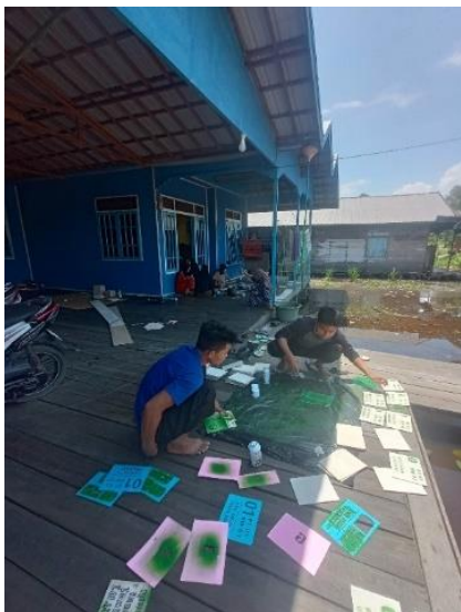
Gambar 4. Tahap Pewarnaan dan Penjemuran

keterangan KKN bertujuan sebagai identitas bahwa Mahasiswa Universitas Nahdlatul Ulama Kalimantan Selatan yang membuat penomoran rumah tersebut. Setelah desain dicetak maka tahap selanjutnya adalah pemotongan mengikuti semua pola yang terletak pada desain dengan menggunakan silet.