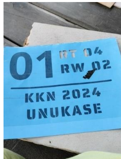
Gambar 3. Contoh Desain Cetakan

Gambar 2 adalah tahap awal pengerjaan yakni memotong triplek menjadi menjadi satuan 15x20 cm, sebelum ke tahapan tersebut triplek dicat terlebih dahulu dengan menggunakan cat dasar putih secara merata pada permukaan triplek, lalu setelah cat mengering barulah dilakukan tahap pemotongan.