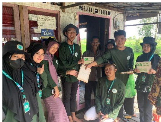
Gambar 6. Pemasangan Nomor Rumah

Proses terakhir adalah tahap pemasangan nomor rumah, pada proses pemasangan ini mahasiswa berkeliling desa dari rumah ke rumah untuk menyerahkan sekaligus memasang nomor rumah yang telah dibuat. Hal ini bertujuan untuk berinteraksi dengan warga Desa Sampurna secara menyeluruh dengan total rumah yang dibuatkan nomor rumah sebanyak 212 rumah. Warga Desa Sampurna sangat senang dan merespon dengan sangat positif ketika dilakukannya penyerahan sekaligus pemasangan nomor rumah.