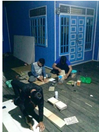
Gambar 2. Tahap Pemotongan Triplek

ukuran 15x20 cm dengan menggunakan teknik manual cat semprot dan memerlukan bahan sebagai berikut (1) triplek 120x240 cm sebanyak 3 lembar, (2) cat semprot pilok sebanyak 8 kaleng, (3) cat dasar warna putih 2 kaleng, (4) thinner 4 botol, (5) 3 kuas cat ukuran sedang, (6) pisau cutter dan silet, (7) pensil dan penggaris, (8) kertas karton. Semua keperluan tersebut memiliki total estimasi biaya sebesar Rp. 668.000,00.