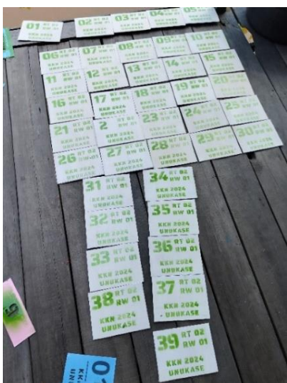
Gambar 5. Hasil Nomor Rumah

Tahapan selanjutnya adalah proses pewarnaan dan penjemuran ditunjukkan pada gambar di atas, pada tahap pewarnaan pertama-tama kertas cover yang sudah dibuat polanya kemudian ditempelkan pada triplek yang sudah dipotong dengan menggunakan jepitan baju. Selanjutnya, penyemprotan dilakukan dengan pilok sesuai urutan nomor rumah, pada tahap selanjutnya setelah didiamkan beberapa saat cover dilepas dari triplek, dan terakhir triplek yang sudah dicat menggunakan cat semprot dijemur dibawah panas matahari. Hasil dari keseluruhan proses tersebut ditunjukkan pada gambar 5.