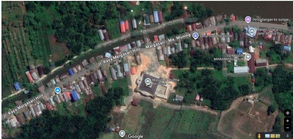
Gambar 1. Peta Lokasi Masjid Al Wustha

Oleh karena itu, usaha untuk memastikan pasangan granit dan sejenisnya bisa menempel dengan kuat dan awet sangat penting. Hal spesifik yang melatarbelakangi penelitian ini adalah banyaknya kasus dinding granit yang terlepas di beberapa bangunan masjid dan langgar. Adapun sampel yang diamati adalah lepasnya granit dinding Masjid Al Wustha, Desa Marampiau Hilir, Kecamatan Candi Laras (Margasari), Kabupaten Tapin. Dalam bacaan Google Map, berada pada koordinat -2.874291, 114.969531.