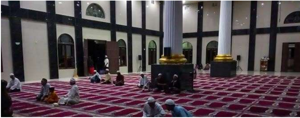
Gambar 14. Granit interior kanan dan belakang tetap terpasang

Granit eksterior, mengalami banyak kerusakan. Eksterior dimaksud terdiri atas :