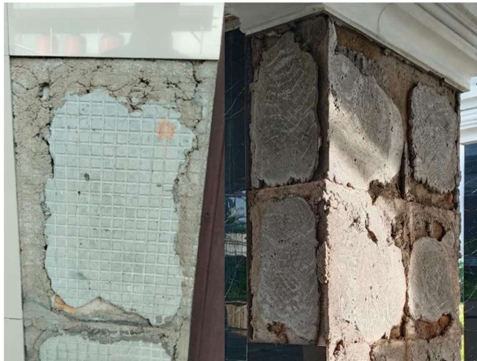
Gambar 20. Bekas pasta perekat dengan warna yang bagus, tetapi tidak penuh