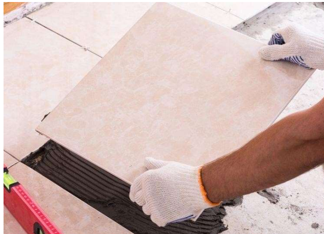
Gambar 9. Pemasangan granit

Standar ukuran (kepala) dalam memasang lantai granit ini dimulai dari satu keping memanjang, bukan melebar. Sedangkan untuk pemasangan lantai granit yang nyaris tidak menggunakan nat dimulai dengan memasang 3 baris secara memanjang terlebih dulu. Adapun arah pemasangan yang benar yaitu dimulai dari sisi bagian dalam menuju ke sisi bagian luar. Artinya adalah Anda harus memasang lantai granit dari area tengah ruangan terlebih dahulu. Lantas dilanjutkan ke tepi hingga menuju ke area pinggir ruangan. Jangan pernah memasang lantai granit ini dimulai dari sisi bagian luar menuju ke sisi bagian dalam sebab akan mengakibatkan hasil pekerjaan Anda menjadi tidak rapi.