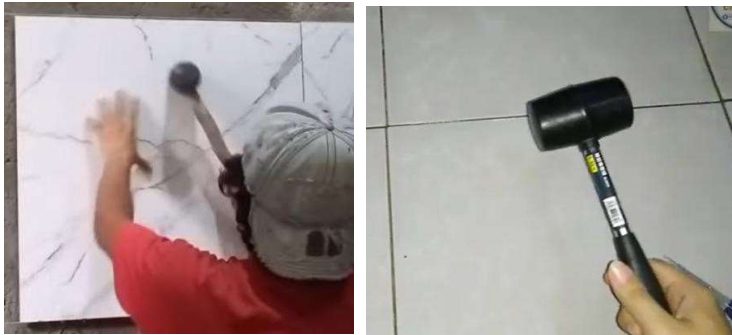
Gambar 11. Palu karet dan pemukulan pemasangan keramik dinding

Biasanya pekerja akan memasang keramik atau granit pada dinding, dan meratakannya dengan palu karet. Pukulan karet ini untuk ukuran yang kecil masih bagus. Tetapi untuk bidang yang besar seperti kebanyakan ukuran granit, ada kemungkinan tidak merata.