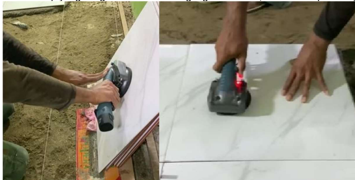
Gambar 12. Penggunaan vakum dan getar alat vibrator

Untuk mengatasinya, dapat digunakan alat penggetar mekanik. Alat vibrator ini selain sebagai penggetar yang menggantikan pukulan palu, juga mempunyai fungsi vakum/hisap yang sangat membantu mengangkat keramik, dan menempatkannya di posisi pasangannya.