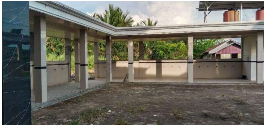
Gambar 19. Sisi selasar wudu belakang