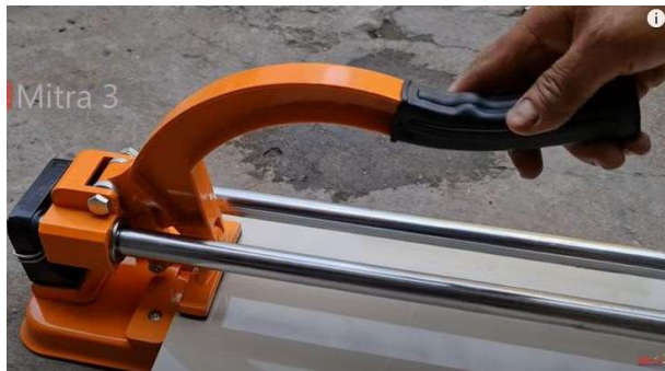
Gambar 5. Alat potong manual

Penggunaan gerinda menghasilkan bunyi yang bising dan debu dari meteri penyusun granit yang terkiskis mata gerinda. Selain itu, bahaya yang lebih besar adalah panas yang timbul akibat gesekan yang hebat dengan mata gerinda. Sangat penting untuk mendinginkan granit sebelum dipasang.