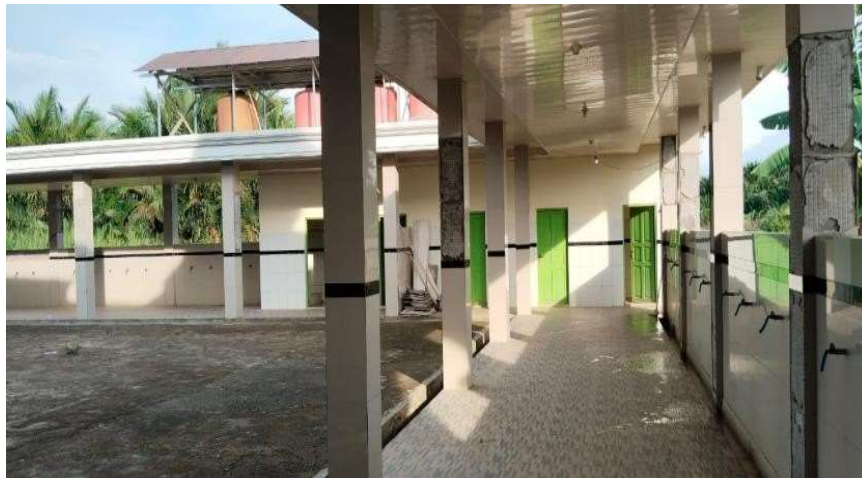
Gambar 17. Sisi selasar wudu kiri

Tiang kecil adalah tiang di sepanjang koridor wudu dan toilet di arah belakang masjid.