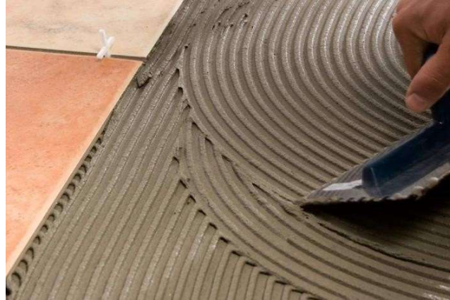
Gambar 8. Meratakan pasta perekat pada dinding

Standar ukuran (kepala) dalam memasang lantai granit ini dimulai dari satu keping memanjang, bukan melebar. Sedangkan untuk pemasangan lantai granit yang nyaris tidak menggunakan nat dimulai dengan memasang 3 baris secara memanjang terlebih dulu. Adapun arah pemasangan yang benar yaitu dimulai dari sisi bagian dalam menuju ke sisi bagian luar. Artinya adalah Anda harus memasang lantai granit dari area tengah ruangan terlebih dahulu. Lantas dilanjutkan ke tepi hingga menuju ke area pinggir ruangan. Jangan pernah memasang lantai granit ini dimulai dari sisi bagian luar menuju ke sisi bagian dalam sebab akan mengakibatkan hasil pekerjaan Anda menjadi tidak rapi.