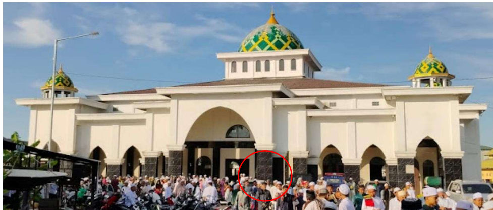
Gambar 15. Satu-satunya granit yang lepas di sisi kanan masjid

Sebagian besar kerusakan terjadi di bagian belakang, dan kiri. Di bagian depan (arah kiblat) tidak terdapat ekspos tiang seperti ini, dan tidak dilapisi granit. Perkiraan logisnya adalah karena sisi ini tidak termasuk daerah aktivitas jamaah. Sedangkan bagian kanan "hanya" satu lembar granit yang lepas, hitam, dan ukuran utuh.