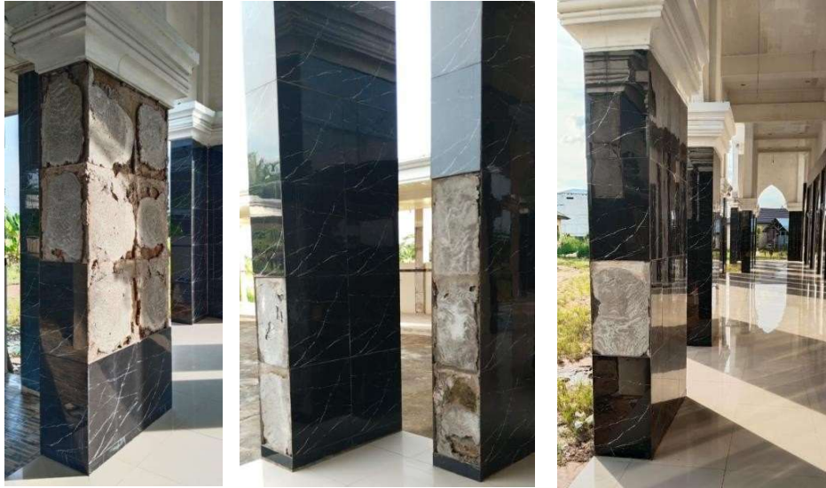
Gambar 16. Sisi tiang besar yang granitnya terlepas