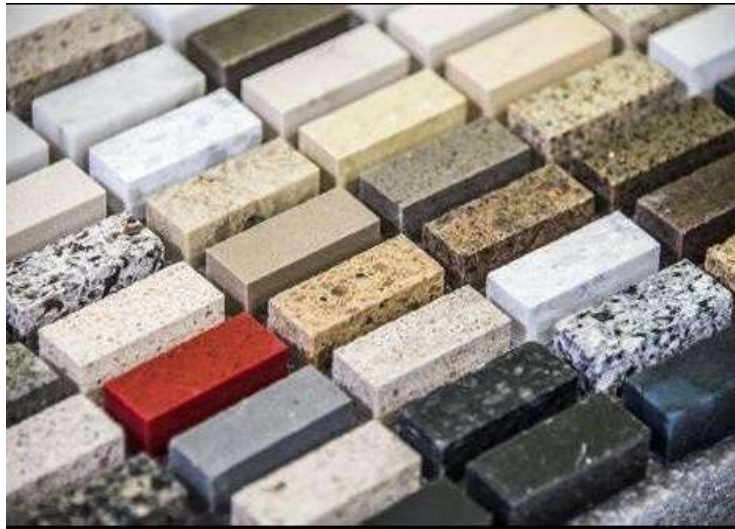
Gambar 3. Sampel granit (MAT, 2018)

sering digunakan untuk aplikasi pada permukaan keras. Batu granit emas, dengan warna dasar netral, sangat cocok untuk ruangan besar seperti gedung. Sementara itu, granit coklat, dengan nada hangat dan warna netral, mampu melengkapi berbagai jenis bahan seperti logam, keramik, dan kayu, menjadikannya pilihan yang serbaguna.