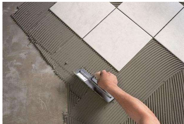
Gambar 7. Pembuatan Dasar

Pembuatan lantai dasar ini bersifat opsional artinya Anda tidak perlu membuatnya lagi jika sudah ahli. Adanya dasar ini berfungsi untuk mempermudah kita dalam memasang lantai granit, terutama untuk memastikan lantai tersebut sudah dipasang dengan rata atau belum. Dasar ini terbuat dari campuran pasir dan semen dengan perbandingan 3:1. Jadi tidak ubahnya dasar ini berupa lantai semen. Buatlah lantai semen yang mempunyai permukaan yang benar-benar rata. Kemudian tunggulah sampai lantai kering. Dengan adanya lantai dasar tersebut, pemasangan granit akan lebih mudah.