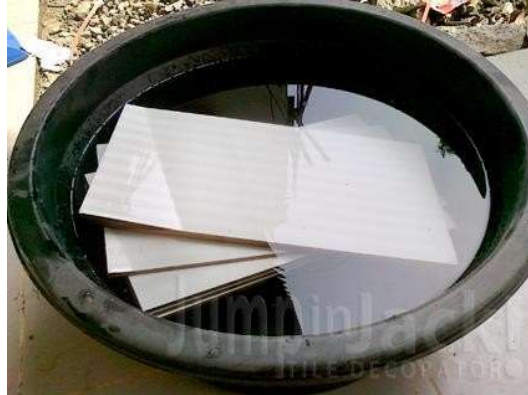
Gambar 10. Perendaman keramik

Perendaman biasanya dilakukan dalam ember/baskom yang tersedia di pasaran. Sayangnya ukurannya hanya cocok untuk keramik biasa yang umumnya 30x30 atau 40x40 cm 2 . Sedangkan granit, umumnya ukurannya 60x60 cm 2 . Ukuran ini tidak bisa masuk seluruhnya ke dalam ember yang diameternya lebih kecil dari diagonal granit. Karena itu, untuk merendam granit, diperlukan bak sendiri berbentuk persegi. Kita tidak perlu membuat bak permanen. Cukup dengan papan bekas, lebihkan ukurannya 10 – 20 cm dari ukuran keramik, lalu lapiasi dengan lembaran plastik. Masukkan air, maka bak rendaman sudah siap.