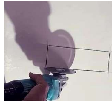
Gambar 6. Alat potong gerinda