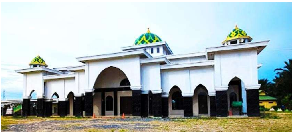
Gambar 2. Masjid Al Wustha, tampak samping kanan arah kiblat