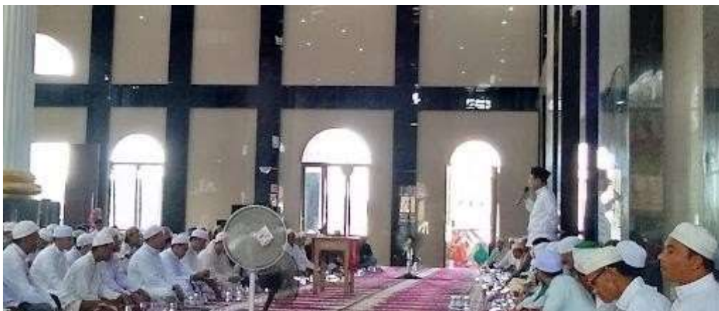
Gambar 13. Granit interior kiri tetap terpasang