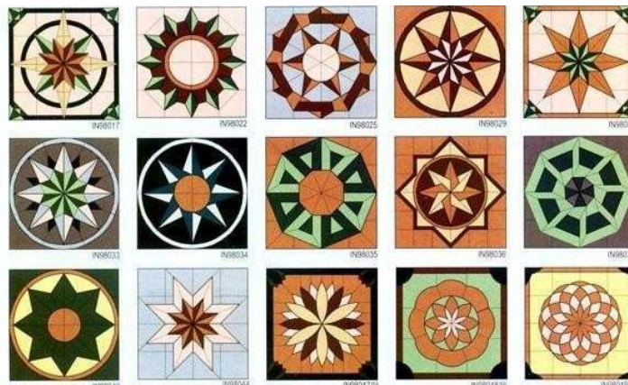
Gambar 4. Contoh pola lantai homogenius tile

Granit buatan (homogenius tile) terbuat dari lempung putih yang dicampur dengan material alami, seperti kaolin, serta pewarna khusus, dihaluskan sampai menjadi bubuk, kemudian dicetak, dipress dan dibakar. Tekstur granit buatan dapat dibedakan : polish (permukaan halus), unpolish (permukaan tidak halus), rock tile (permukaan kasar/bertekstur), dan glasur.